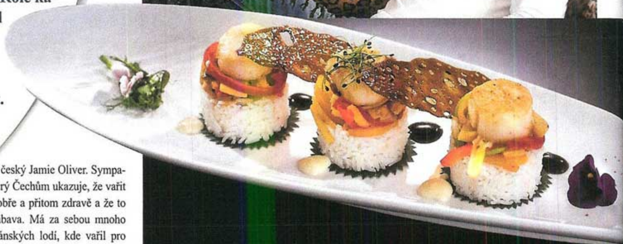
Mušle sv. Jakuba

hvězd úspěch, ale prý se i stalo, že se netrefil. Třeba když se snažil propagovat typicky českou kuchyni. „Jacku Nicholsonovi nechutnala, prý je to moc moučné. Tam totiž nejsou zvyklí zahušťovat omáčku moukou. Tak jsem mu hned uvařil něco jiného,“ přiznává Roman. Největší úspěch prý naopak slavil s polévkami, na které je ze svých původních receptů nejvíce pyšný.